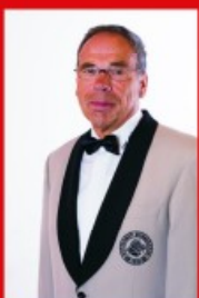
Wolfgang Paul 75 Jahre